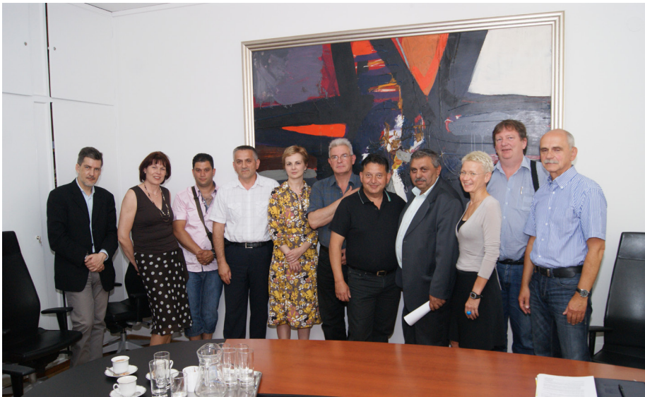
Delegation im Rathaus von Zagreb

von der Außenwelt müssen sie in sehr primitiven, schäbigen Holzverschlängen ihr Leben fristen. Bis zu zehn Personen zwängten sich auf engstem Raum zusammen und sind - ohne Aussicht auf Verbesserung - den Schikanen der Behörden ausgeliefert. Die anfängliche Zurückhaltung hat sich bald gelegt, viele Fragen und Unmutsäußerungen machen jetzt die Runde, es werden Rechnungen der Behörden vorgezeigt; etwa Wasserrechnungen in der Höhe von zigtausend Euro, also für diese Familien unbezahlbar. Dadurch ergeben sich untragbare Verhältnisse im Umgang mit den zuständigen Behörden, die auf ihre Zahlungen pochen, egal ob diese möglich, geschweige denn gerechtfertigt sind. Der uns begleitende ORF Kameramann Bernhard Karall durfte das Innere der Behausungen filmen, eine Dokumentation die Ihresgleichen sucht. Auffallend ist, dass sich fast ausschließlich die Frauen der Diskussion gestellt haben, die Männer haben sich